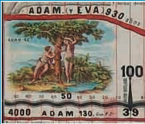
◀ FIGURA 1. Ilustración de la primera página de la Carta sincronológica (Fotografía Victoria Casado, 2010; cortesía del STRDOGP, ENCRyM-INAH).