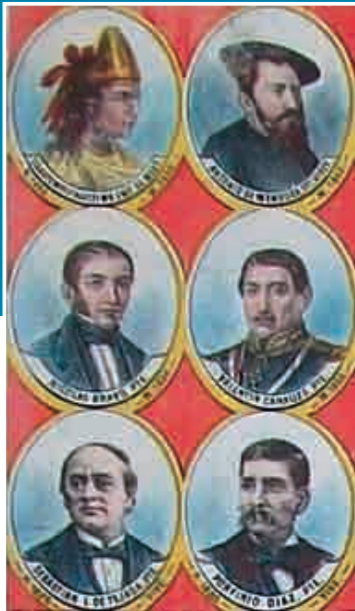
◀ FIGURA 3. Detalle de la última sección de la Carta sincronológica , “principales gobernantes de México”.