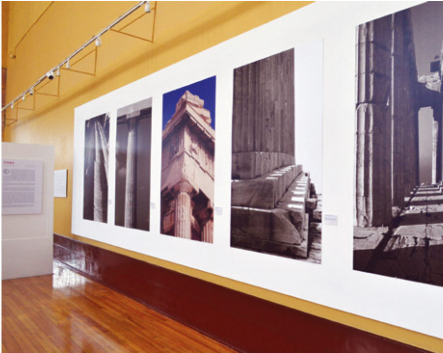
FIGURA 4. Exposición Partenón: arquitectura y arte , muro norte, MNA-INBA, México.