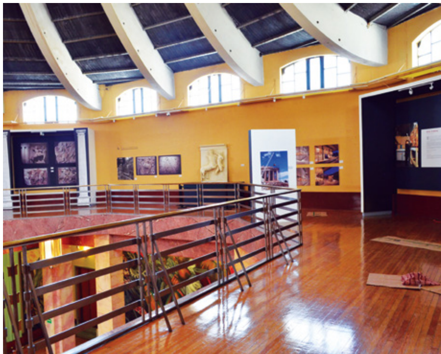
FIGURA 5. Exposición Partenón: arquitectura y arte , muro este; al centro, reproducción del dintel que representa la guerra de los centauros, MNA-INBA, México (Fotografía: Josué Flores, 2013; cortesía: fototeca MNA-INBA, DACPAI-INBA).

la arquitectura. De acuerdo con las directrices tecnológicas actuales, el museo también dispone de un recorrido virtual por las instalaciones y se mantiene en comunicación constante con el público por medio de la red social Facebook .