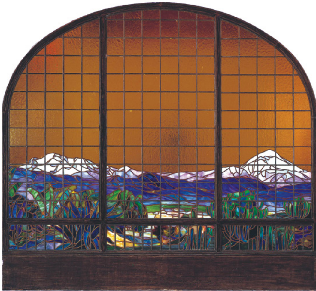
FIGURA 7. Diseño del telón de cristal de la sala principal del Palacio de Bellas Artes, INBA (Maqueta: Geza Maróti ca.1908; cortesía: fototeca DACPAI-INBA).

nes: hoy en día tanto el Departamento de Investigación como el equipo de museografía de este recinto afronta varios retos, entre los que está el establecer más vínculos con universidades, centros de investigación e institutos culturales con el objeto de divulgar las muestras de arquitectura que se han presentado en el museo. Por otra parte, es evidente que tiene la necesidad de lograr una mayor difusión hacia la sociedad en general, para lo que será fundamental, además de aumentar la visibilidad del MNA-INBA, cuya vocación y oferta, por encontrarse en el tercer nivel del PBA —un edificio con considerable visita tanto nacional como internacional—, suelen pasar inadvertidas, solventar las medidas precautorias de acceso (si bien necesarias para el cuidado de un inmueble declarado monumento artístico) que llegan a desalentar a sus visitantes. Asimismo, parece fundamental cambiar la idea de que, por tratarse de un museo especializado, sus contenidos están acotados a los profesionales de la arquitectura. En esta tarea resulta esencial configurar un paquete museográfico que efectivamente acerque la cultura arquitectónica a estudiantes de diferentes grados, y despierte en ellos el interés por una disciplina cuyas obras