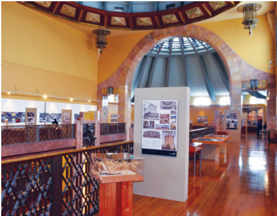
FIGURA 3. Vista general de la exposición Presencia del exilio español en la arquitectura mexicana , MNA-INBA, México.