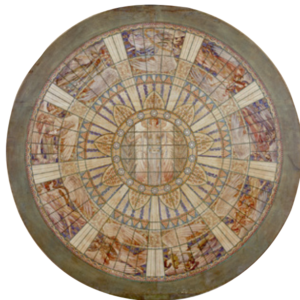
FIGURA 8. Acuarela original del plafón luminoso de cristal de la sala principal del Palacio de Bellas Artes, INBA (Dibujo: Geza Maróti, ca. 1910).

nes: hoy en día tanto el Departamento de Investigación como el equipo de museografía de este recinto afronta varios retos, entre los que está el establecer más vínculos con universidades, centros de investigación e institutos culturales con el objeto de divulgar las muestras de arquitectura que se han presentado en el museo. Por otra parte, es evidente que tiene la necesidad de lograr una mayor difusión hacia la sociedad en general, para lo que será fundamental, además de aumentar la visibilidad del MNA-INBA, cuya vocación y oferta, por encontrarse en el tercer nivel del PBA —un edificio con considerable visita tanto nacional como internacional—, suelen pasar inadvertidas, solventar las medidas precautorias de acceso (si bien necesarias para el cuidado de un inmueble declarado monumento artístico) que llegan a desalentar a sus visitantes. Asimismo, parece fundamental cambiar la idea de que, por tratarse de un museo especializado, sus contenidos están acotados a los profesionales de la arquitectura. En esta tarea resulta esencial configurar un paquete museográfico que efectivamente acerque la cultura arquitectónica a estudiantes de diferentes grados, y despierte en ellos el interés por una disciplina cuyas obras